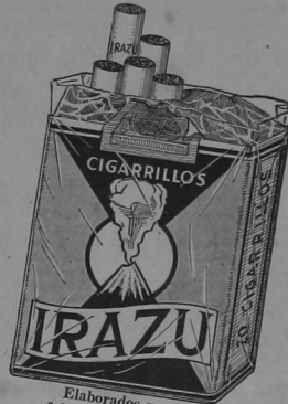
Elaborados por los fabricantes de Liberty.