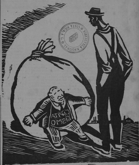
Ahora Roosevelt manda a la policía a que defienda a bala estas ganancias.

mos de nuevo al Rev. Dean de Canterbury que nos dice en su libro lo siguiente: "La mitad del al algodón empleado en la Rusia zarista venía del extranjero. Ahora no entra ni una onza de algodón del extranjero. La URSS cosecha todo el algodón que necesita, sin el cual no podría vestirse ni hacer frente a las necesidades de la guerra. Los Soviets han ampliado su producción y modernizado sus métodos. El mapa del algodón se ha extendido mucho en la URSS, y los científicos de la agricultura han logrado producir un algodón que resiste la sequía. Ahora inmensas estepas secas son campos de algodón. El área cultivada de algodón ha crecido en tres cuartos, con relación a la Rusia pre-revolucionaria."